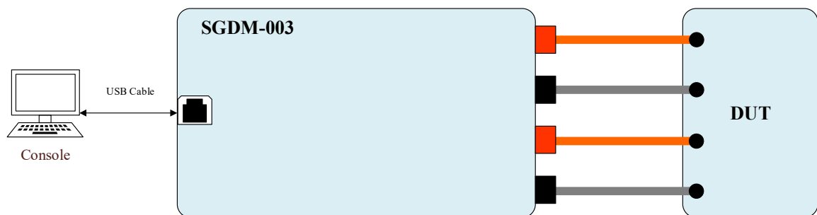
图 1 SGDM-003 典型应用

SGDM-003 通过测量引线与 DUT 连接，控制台 (Console) 通过 USB 线 (USB Cable) 发送指令至 SGDM-003 进行测量，然后 SGDM-003 将测量结果以及测量数据反馈至控制台。